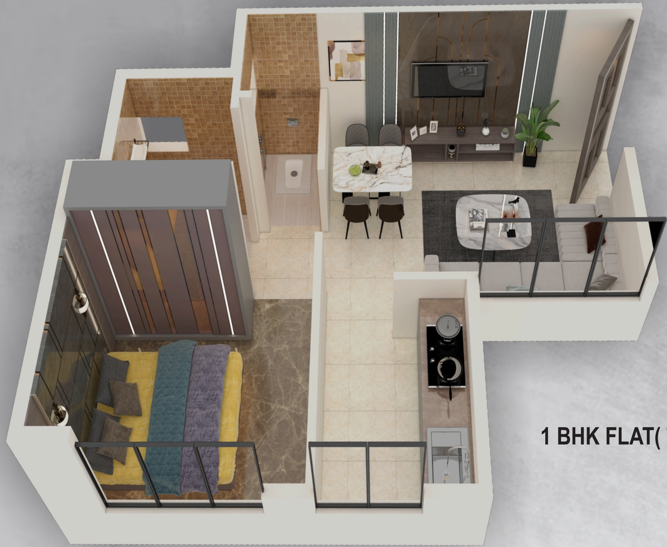
1 BHK FLAT( TYPE-B)