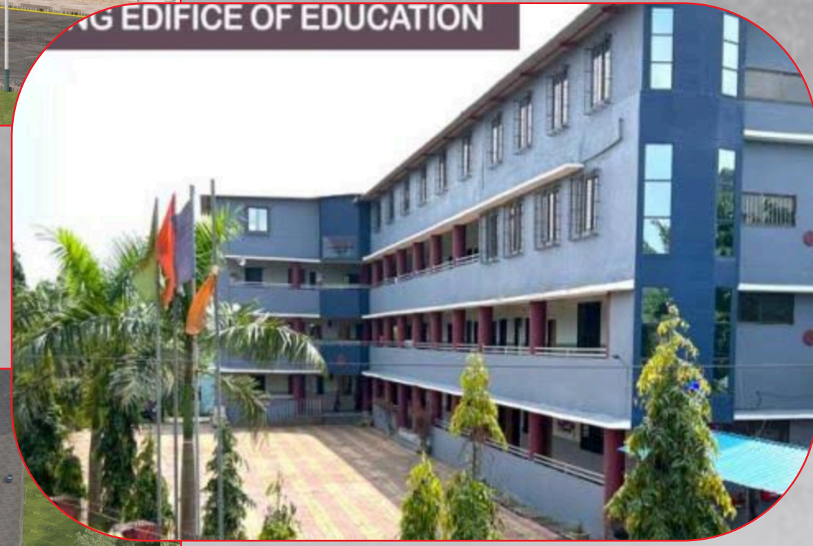
GREATER VALLEY SCHOOL