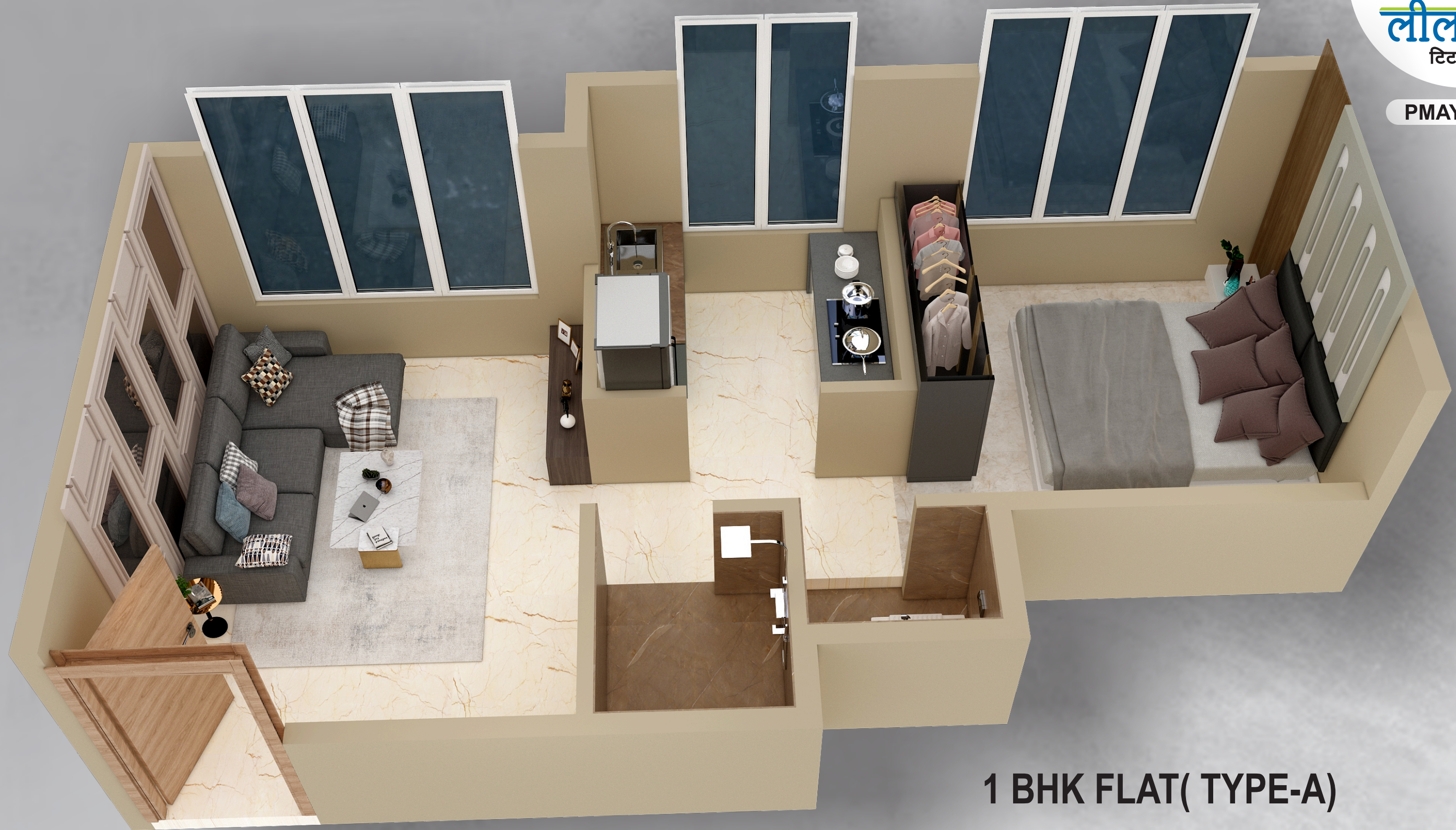
1 BHK FLAT( TYPE-A)