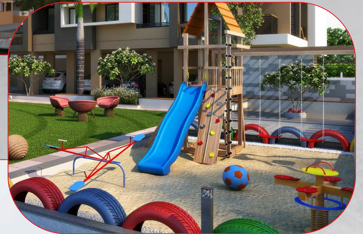
CHILDREN PLAY AREA