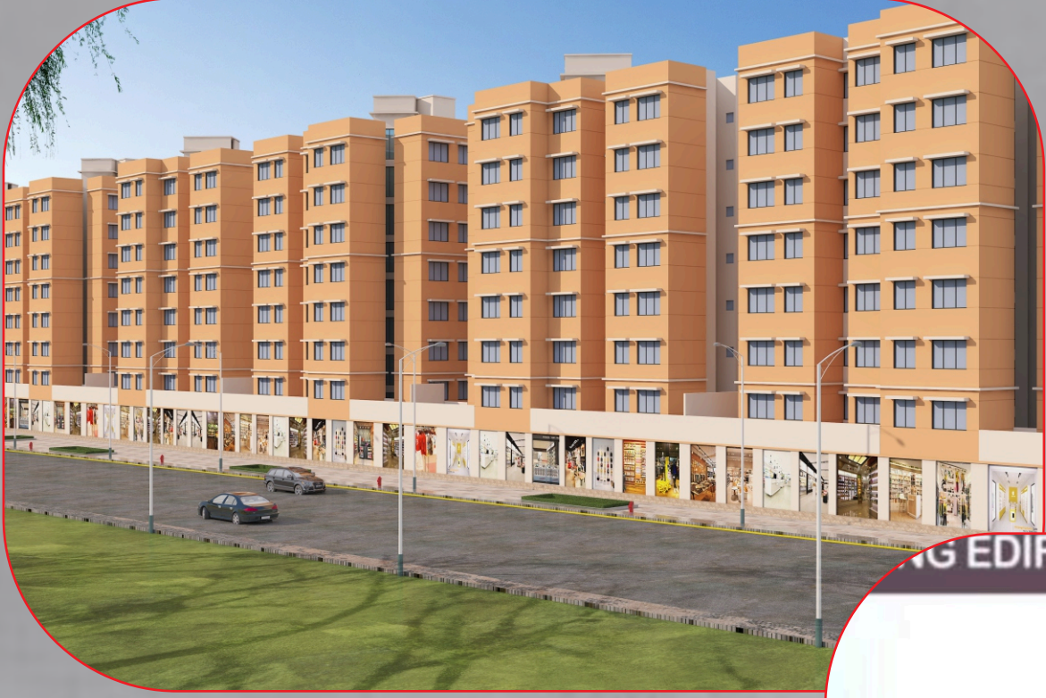
THE GREAT EDIFICE OF EDUCATION